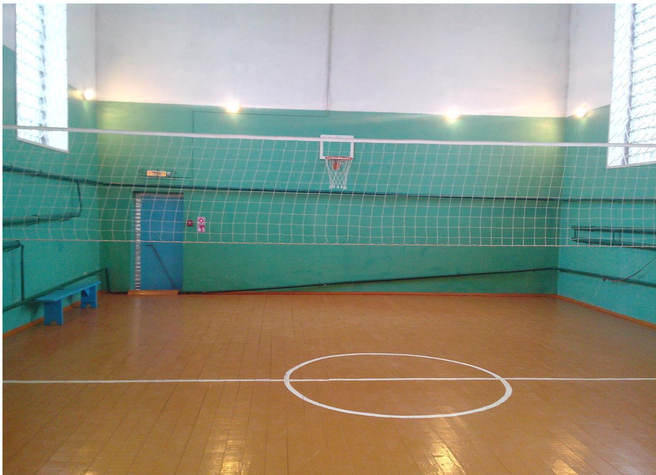
2. Визуализация будущего проекта